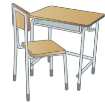
福岡会場への通学