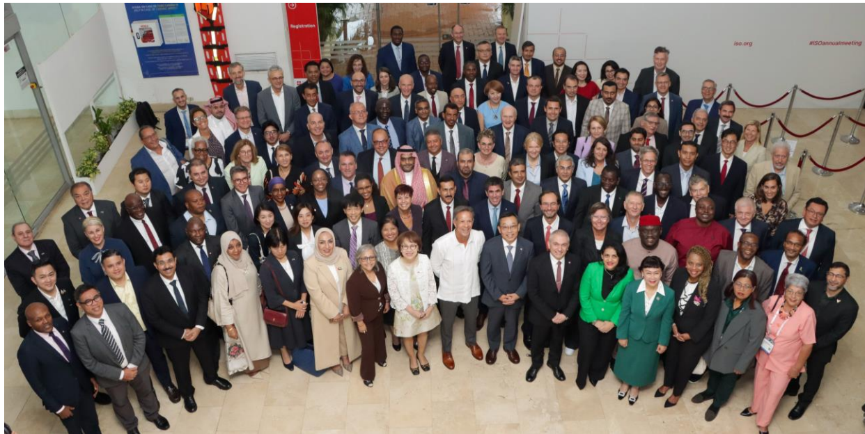
ヘッドオブデリゲーションの集合写真