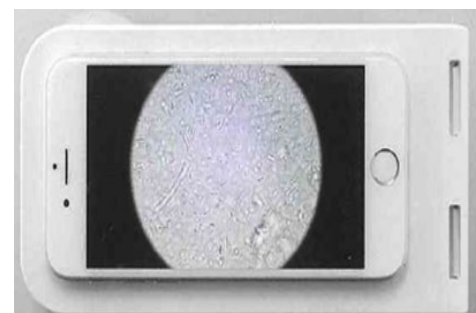
スマートフォンやタブレットで観察可能