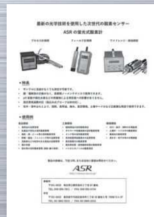
製品紹介を入れた例