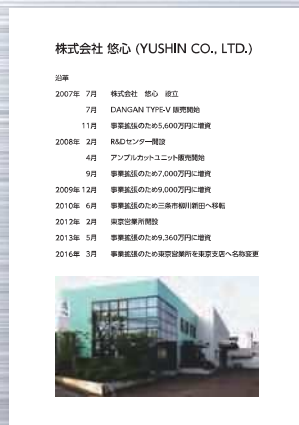
沿革と本社写真を入れた例