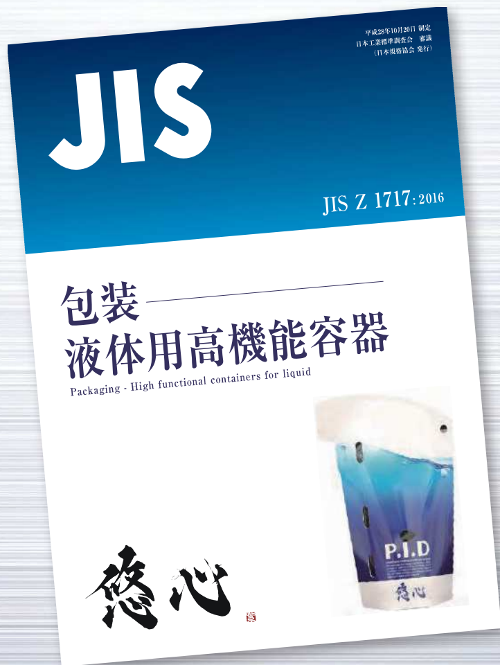
表1 企業ロゴ、製品写真を入れた例