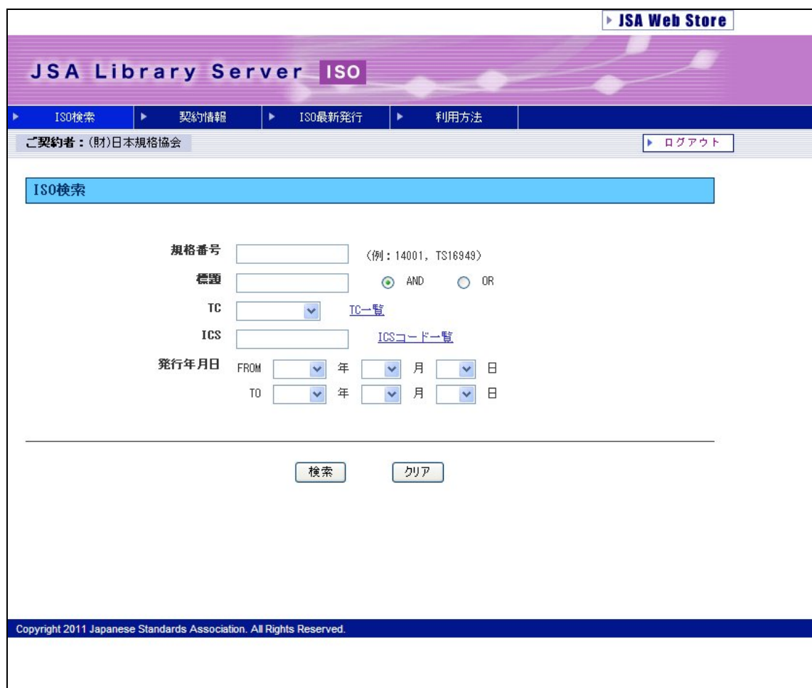
図 2-B. JSA ライブラリサーバ ログオン後画面(ISO の場合)